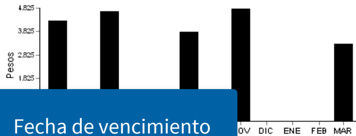
Gráfico de las últimas boletas/facturas emitidas

Fecha de vencimiento de la cuenta y valor a pagar